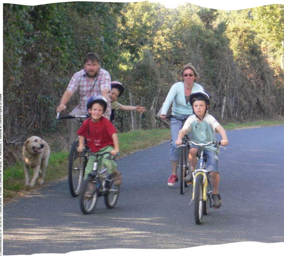
02 99 99 54 22 - infographie/Impression IZATIS Communication 02 97 26 00 42