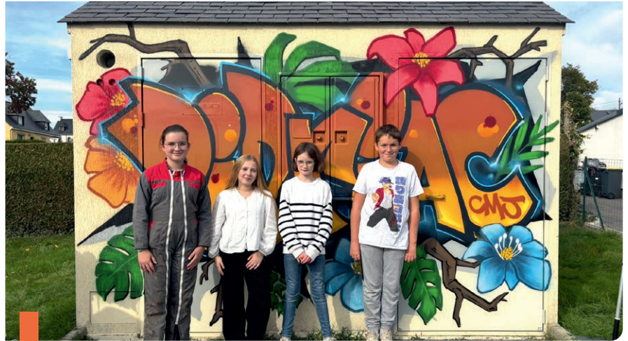
Les jeunes élus devant leur réalisation.

Pendant plusieurs mois, les jeunes élus ont travaillé sur ce projet, notamment en choisissant le prestataire et en définissant le design final. La réalisation de la fresque a été confiée au collectif rennais La Crèmerie, spécialisé dans les œuvres grand format, en partenariat avec Enedis, utilisateur du transformateur et co-financier du projet.