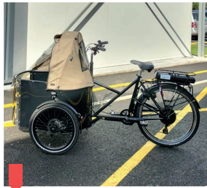
Locations de vélos familiaux ou ateliers de réparation sont proposés.

Recyclea propose également une gamme complète de services pour les cyclistes de tous niveaux : vélos électriques, triporteurs,