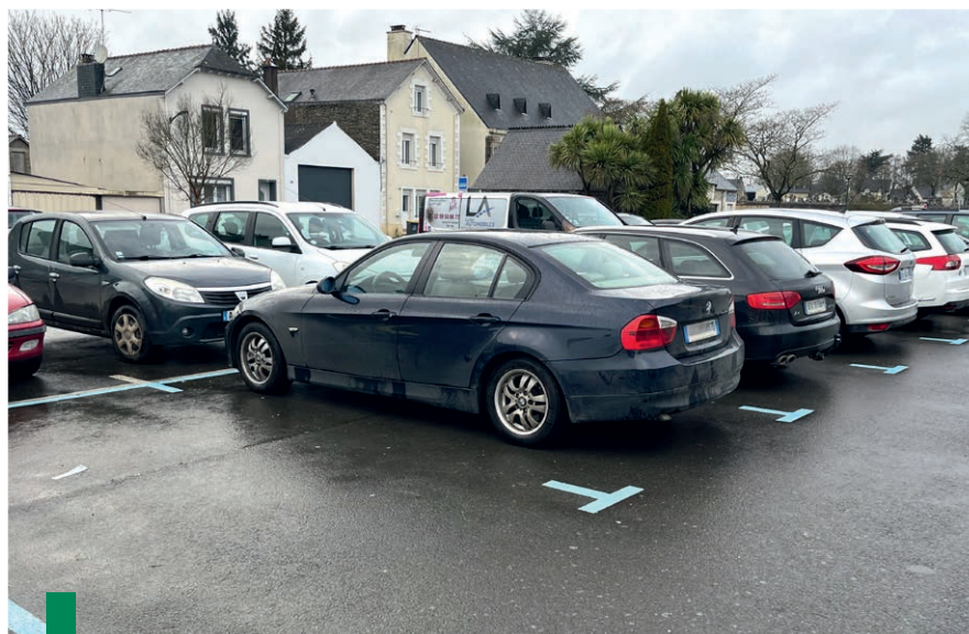
La zone bleue aménagée place de la Libération.

Pour les riverains ou les salariés ayant besoin de stationner toute la journée, il reste plus de 170 places disponibles et non réglementées, à moins de 300m de la place de Verdun, par exemple au niveau du parking de l'église.