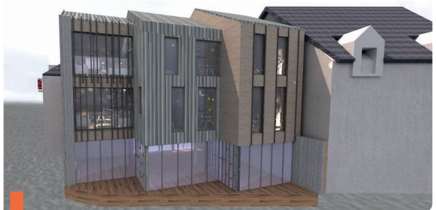
Le futur bâtiment comprendra quatre logements ainsi qu'une cellule commerciale (crédit : Goubin architecte)

L'Établissement Public Foncier de Bretagne a acquis le bâtiment pour le compte de la mairie. Cette opération permet à la mairie de