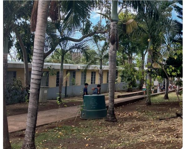
Les 20 élèves de la classe de CM2 de Jean de la Fontaine (à gauche) correspondent avec une classe réunionnaise de 26 enfants. A droite, l'école réunionnaise, bien loin du paysage quotidien des enfants pipriatins !

Cette année, les 20 élèves de CM2 de l'école Jean de la Fontaine ont commencé une correspondance avec une classe de CM2 de l'école publique des Combavas, à La Plaine Saint-Paul, sur l'île de La Réunion.